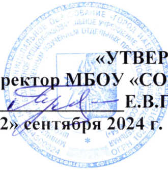
График питания в школьной столовой на 2024-2025 учебный год